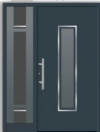
Modell KU 333 | AL 333 Außen Edelstahl-Liase aufgesetzt, 20 mm breit, innen glatt ○ RAL 7016 ○ Glas Satriato ○ Griff EAS 500 ○ Selenal ST 333, Glas Satriato / Klages mit Edelstahlapplikation ○ Ausführung Flügelüberdeckend