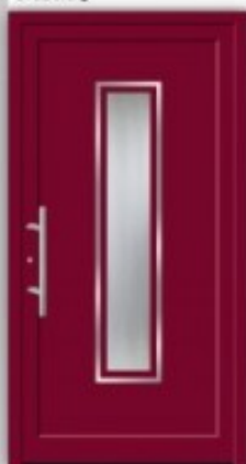
Modell KU 333 | AL 333 Außen:Edelstahl-Liene aufgesetzt, 20 mm breit, innen glatt RAL 3005 Glas Ornament C Griff EAS 300 Faltfüllung