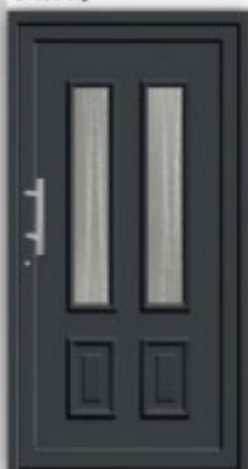
Modell KU 323 | AL 323 Außen wie Abbildung, innen Gashalterahmen ohne Kassette unten RAL 7016 Glas Ornament C Griff EAS 350 Faltfüllung