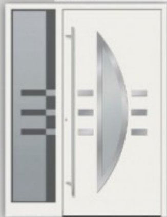
Modell KU 120 | AL 120 Edelstahlapplikationen außen, Innen Glashalterahmen ○ RAL 9016 ○ Glas Satinato ○ Griff EAS 1600 ○ Setelement ST 120, Glas Motivglas Satinato / Klarglas ○ Ausführung Flügelüberdeckend