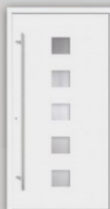
Modell KU 18 | AL 18 Außen wie Abbildung, innen Glashaltedahmen ○ RAL 9016 ○ Glas Satinato ○ Griff EAS 1600 ○ Ausführung Flügelüberdeckend