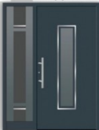
Modell KU 333 | AL 333 Außen Edelstahl-Liame aufgesetzt, 20 mm breit, innen glatt ○ RAL 7016 ○ Glas Satriato ○ Griff EAS 500 ○ Scharnkel ST 333, Glas Satriato / Klages mit Edelstahlapplikation ○ Ausführung Flügelüberdeckend