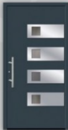
Modell KU 110 | AL 110 Edelstahlapplikationen außen, innen Gashalterahmen ○ RAL 7016 ○ Glas Ornament C ○ Griff EAS 500 ○ Ausführung Flügelüberdeckend