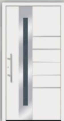
Modell KU 130 | AL 130 Edelstahlapplikationen außen, innen Gashalterahmen ○ RAL 9016 ○ Glas Satriato ○ Griff EAS 500 ○ Ausführung Flügelüberdeckend