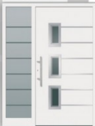
Modell KU 13 | AL 13 Edelstahlapplikationen außen und innen ○ RAL 9016 ○ Glas Satinato/Klarglas ○ Griff EAS 500 ○ Seitenteil ST 13, Satinato mit klaren Streifen ○ Ausführung Flügelüberdeckend