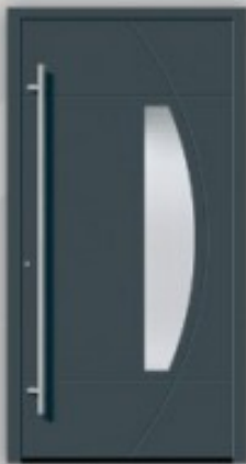
Modell KU 15 | AL 15 Außen-Nutzen, Innen glatt ○ RAL 7016 ○ Glas Mastercam ○ Griff EAS 1600 ○ Ausführung Flügelüberdeckend