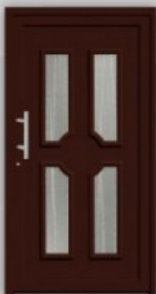
Modell KU 324 | AL 324 Außen wie Abbildung, innen Gashalterahmen RAL 8016 Griff EAS 350 Glas Ornament C Faltfüllung