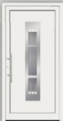
Modell KU 70 | AL 70 Edelstahlapplikationen außen, innen Gashalterahmen ○ RAL 9016 ○ Glas Ornament C ○ Griff EAS 500 ○ Ritzföhrung