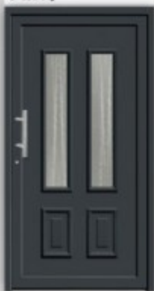
Modell KU 323 | AL 323 Außen wie Abbildung, innen Gashalterahmen ohne Kassette unten RAL 7016 Glas Ornament C Griff EAS 350 Faltfüllung