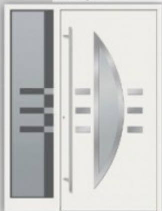
Modell KU 120 | AL 120 Edelstahlapplikationen außen, Innen Glashalterahmen ○ RAL 9016 ○ Glas Satinato ○ Griff EAS 1600 ○ Setelement ST 120, Glas Motivglas Satinato / Klarglas ○ Ausführung Flügelüberdeckend