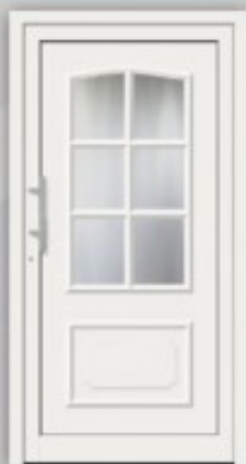
Modell KU 320 | AL 320 Außen wie Abbildung, innen Gashalterahmen ohne Kassette unten RAL 9016 Glas Ornament C Griff EAS 350 Faltfüllung