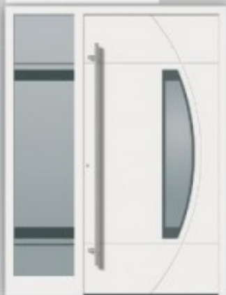
Modell KU 15 | AL 15 Außen Nutzen, Innen glatt ○ RAL 9016 ○ Glas Motivglas ○ Griff EAS 1600 ○ Setelement ST 15, Motivglas ○ Ausführung Flügelüberdeckend