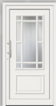
Modell KU 321 | AL 321 Außen wie Abbildung, innen Gashalterahmen ohne Kassette unten RAL 9016 Glas Ornament C Griff EAS 350 Faltfüllung