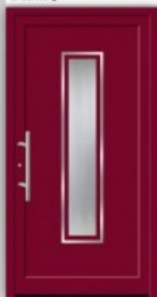
Modell KU 333 | AL 333 Außen:Edelstahl-Liene aufgesetzt, 20 mm breit, innen glatt RAL 3005 Glas Ornament C Griff EAS 300 Faltfüllung