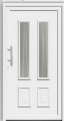
Modell KU 323 | AL 323 Außen wie Abbildung, innen Gashalterahmen ohne Kassette unten RAL 9016 Glas Ornament C Griff EAS 350 Faltfüllung