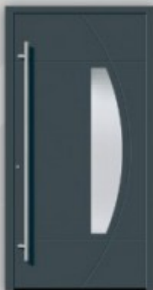
Modell KU 15 | AL 15 Außen-Nutzen, Innen glatt ○ RAL 7016 ○ Glas Mastarcam ○ Griff EAS 1600 ○ Ausführung Flügelüberdeckend