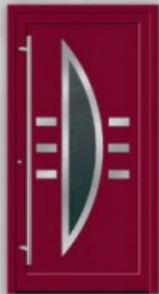
Modell KU 120 | AL 120 Edelstahlapplikationen außen, innen Glashalterahmen ○ RAL 3005 ○ Glas Satinato ○ Griff EAS 1600 ○ Facfällung

Eingelassene Nuten verleihen Ihrer Haustüre einen besonders hochwertigen Charakter