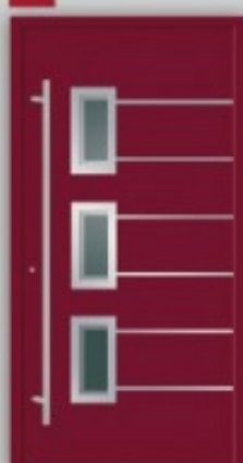
Modell KU 13 | AL 13 Edelstahlapplikationen außen und innen ○ RAL 3005 ○ Glas Satinato/Klarglas ○ Griff EAS 1600 ○ Ausführung Flügelüberdeckend