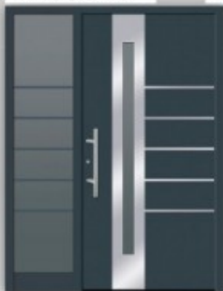
Modell KU 130 | AL 130 Edelstahlapplikationen außen, innen Gashalterahmen ○ RAL 7016 ○ Glas Satriato ○ Griff EAS 500 ○ Scharnkel ST 130, Satriato mit klaren Streifen ○ Ausführung Flügelüberdeckend