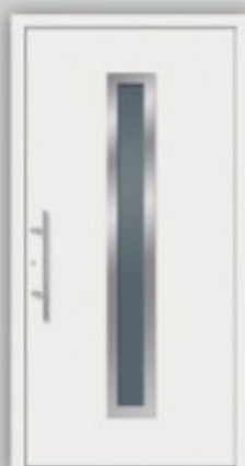
Modell KU 50 | AL 50 Edelstahlapplikationen außen und innen ○ RAL 9016 ○ Glas Klarglas ○ Griff EAS 500 ○ Ausführung Flügelüberdeckend