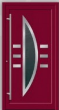
Modell KU 120 | AL 120 Edelstahlapplikationen außen, innen Glashalterahmen ○ RAL 3005 ○ Glas Satinato ○ Griff EAS 1600 ○ Facfällung

Eingelassene Hüten verleihen Ihrer Haustüre einen besonders hochwertigen Charakter